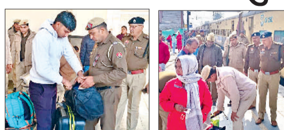
सोनीपत। स्टेशन के प्रतीक्षालय हॉल में यात्री का बैग खुलवाकर जांच करते जीआरपी व आरपीएफ कर्मी।

देशभर में एक दिन बाद मनाए जाने वाले गणतंत्र दिवस को लेकर पुलिस ने सुरक्षा व्यवस्था को कड़ा कर दिया है। इसी को लेकर सोनीपत स्टेशन पर शनिवार को करीब 3 घंटे तक सघन जांच अभियान चलाया गया। इसके अलावा शहरभर में चौक-चौराहों पर पुलिसकर्मियों की तैनाती की गई है। पुलिस कर्मी आवागमन करने वाले हर वाहन चालक, राहगीर पर नजर बनाए हुए हैं। रेलवे स्टेशन के अलावा बस अड्डा परिसर भी पुलिस कर्मियों की नजर में बंद नजर आया। रेलवे स्टेशन के सामने बस अड्डा पर आने वाले प्रत्येक यात्रियों की गतिविधियों पर नजर रखी जा रही है। दिल्ली व अंबाला मुख्यालय के सख्त निर्देश