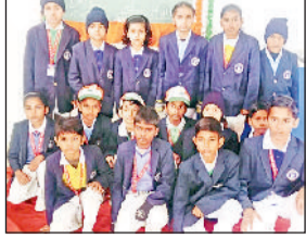
कार्यक्रम में भाग लेते विद्यार्थी।