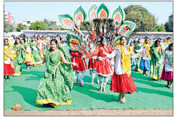
सोनीपत। सोनीपत की पुलिस लाइन में फुल ड्रेस फाइनल रिहर्सल में सांस्कृतिक कार्यक्रम प्रस्तुत करती छात्राएं।