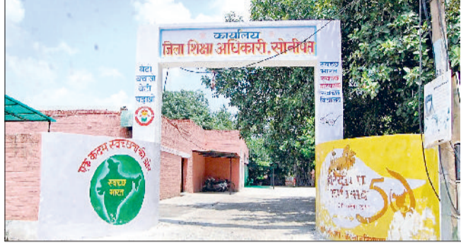
सोनीपत। सोनीपत के सेक्टर-14 स्थित जिला शिक्षा विभाग का कार्यालय।