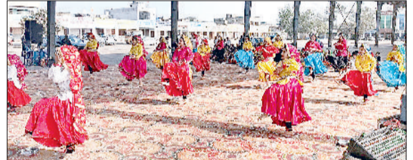
सोनीपत। रिहर्सल के दौरान सांस्कृतिक कार्यक्रम प्रस्तुत करते विद्यार्थी।