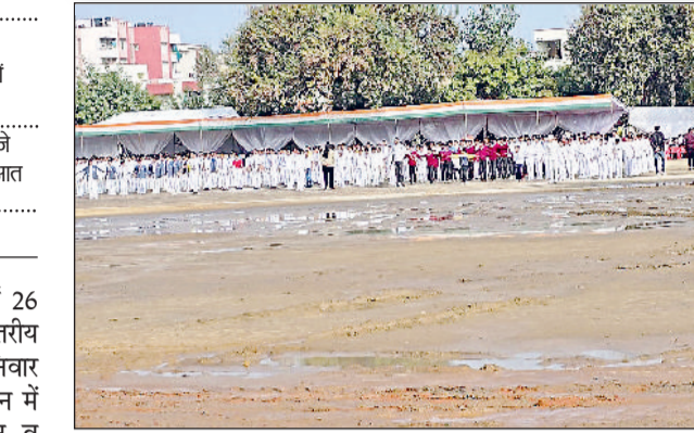
सोनीपत। सोनीपत की पुलिस लाइन में गणतंत्र दिवस समारोह स्थल पर बारिश के बाद हुआ जलभराव व फैला कीचड़।