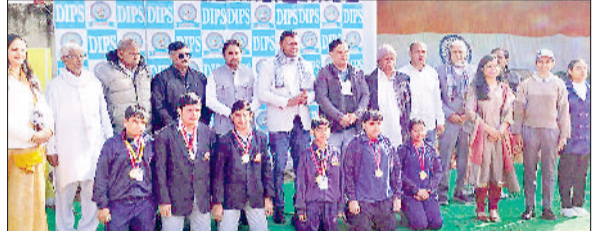
24 केकेडी 5. मेधावी विद्यार्थियों को पुरस्कृत करते गणमान्य।